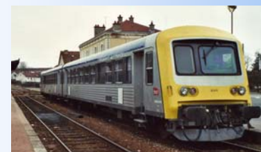
La modernisation des EAD