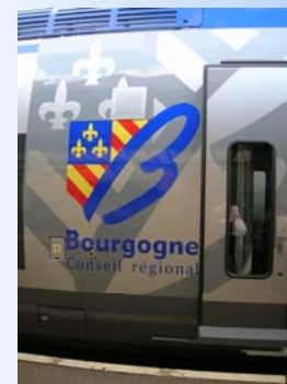
La livrée Bourgogne des AGC